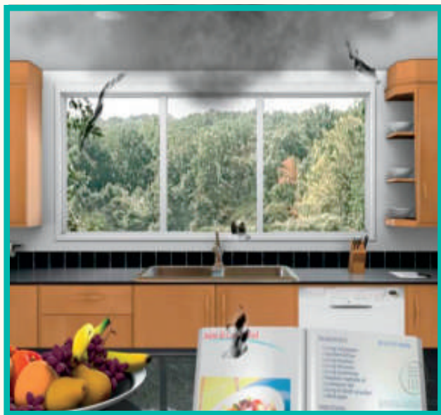
模拟漂浮物如何干扰您的视力。

如果你发现自己的视力不再清楚，并出现漂浮物，不管它是点状、椭圆状还是线状，建议先找眼科医生做眼底检查。假设单纯是老化造成的玻璃体液化，这种情况通常是不需要治疗的。在极少数情况下，飞蚊症突然量变很多，并严重地影响到我们视力。在这些情况下，可能需要进行玻璃体切除术，这是一种治疗飞蚊症的外科手术。玻璃体切除术将从眼睛中去掉玻璃体凝胶及其漂浮的碎片。任何手术都应该考虑到好处和风险，您的眼科医生会仔细地向您讲解。